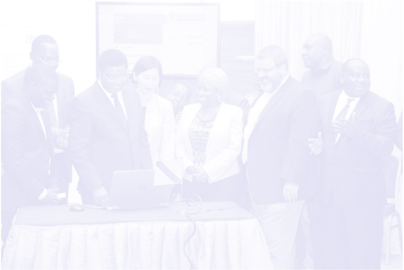
Picha ya mbele: Waziri Mkuu wa Jamhuri ya Muungano wa Tanzania, Mh. Kassim Majaliwa, akizindua rasmi mifumo ya PlanRep na FFARS mjini Dodoma, tarehe 5 Septemba, 2017.