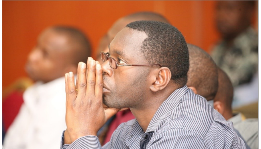
Mmoja wa washiriki wa mafunzo ya mfumo wa PlanRep akifuatilia kwa makini wakati mada zikiendelea kutolewa kwenye mafunzo hayo. (Picha: Mroki Mroki wa Daily News Mtandao).

“Mfumo huu ulikuwa ni mfumo unaojitegemea; haukuweza kusambaza taarifa katika ngazi mbalimbali za Serikali wala kushirikisha watoa huduma kutoa mapendekezo yao yatakayoongeza uboreshaji wa mipango na Bajeti za Serikali, hivyo kwa kuwa tumeuboresha ni wazi kwamba watumiaji wa mfumo huu wanatakiwa kupewa mafunzo,” ameeleza Kibola.