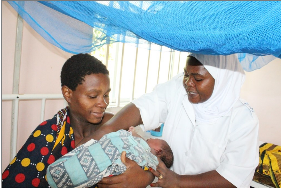
Muuguzi katika kituo cha Afya cha Likombe kilichopo Mtwara-Mikindani akimsaidia mama aliyejifungua katika kituo hicho. Kituo hicho kinachokua kwa kasi katika mji wa Mtwara kutokana na maboresho yanayoendelea kufanywa na Serikali katika sekta ya afya na wadau mbalimbali wa maendeleo.

“Kutokana na kukosekana kwa uwazi hapo awali katika kupanga mipango na bajeti, huduma katika maeneo mengi hazikufikia viwango vinavyotakiwa, hali iliyosababisha Serikali kupoteza rasilimali nyingi na hivyo kukosekana kwa thamani halisi ya fedha kati-