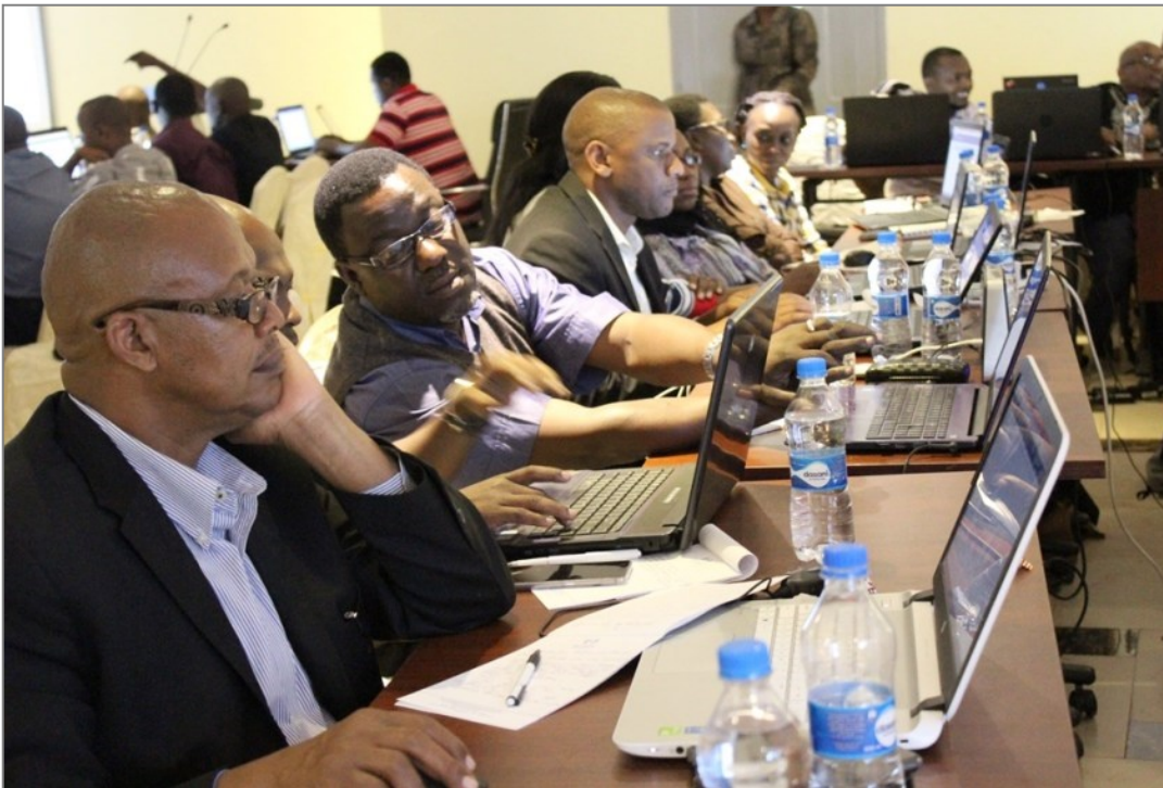
Baadhi ya washiriki wa mafunzo ya mifumo ya PlanRep na FFARS wakifuatilia kwa vitendo mfumo huo wakati wa mafunzo yaliyofanyika mjini Mtwara.