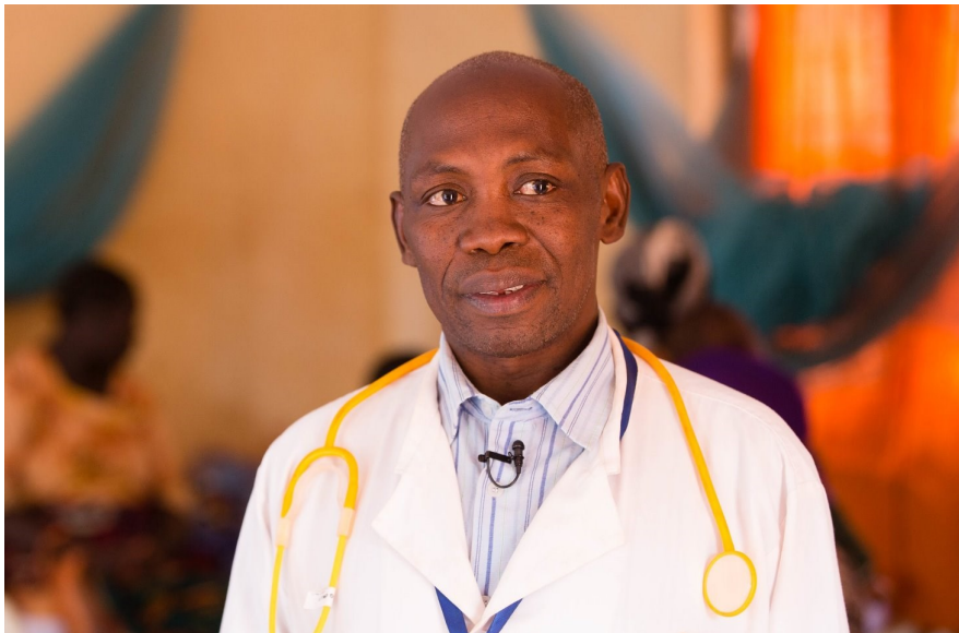
Mmoja wa maafisa kutoka kituo cha afya katika wilaya ya Buhigwe mkoani Kigoma, akizungumzia matumizi ya mifumo yatakavyosaidia utendaji kazi katika sekta ya afya.

Mafunzo ya siku nane ya Mfumo ulioboreshwa wa kuandaa Mipango na Bajeti za Mamlaka za Serikali za Mitaa (PlanRep) kikanda yametolewa mkoani Morogoro kwa waandaaji wa bajeti wa Halmashauri mbalimbali za mkoa ya Pwani, Morogoro, Arusha na Kilimanjaro, ambapo yalifunguliwa na Katibu Tawala wa mkoa wa