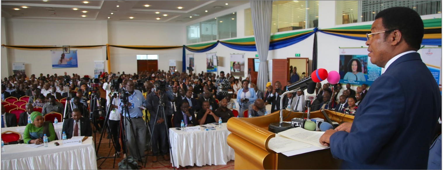
Waziri Mkuu wa Jamhuri ya Muungano wa Tanzania, Mh. Kassim Majaliwa Majaliwa (Mb), akitoa hotuba ya uzinduzi wa mifumo na PlanRep na FFARS mjini Dodoma.

S erikali imewataka watumishi wa Mikoa, Halmashauri na vituo vya kutolea huduma kutoa taarifa za mapato na matumizi kwa wakati kwa wananchi katika maeneo yao, ili kuongeza uwazi.