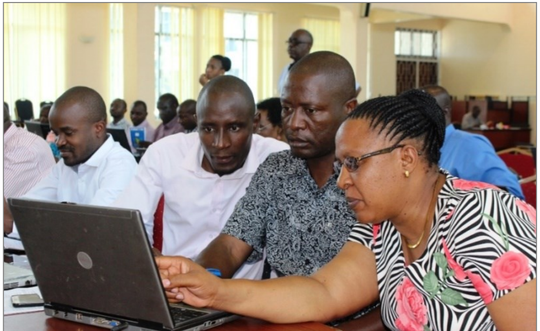
Baadhi ya washiriki wa mfumo wa PlanRep wakati wa mafunzo.