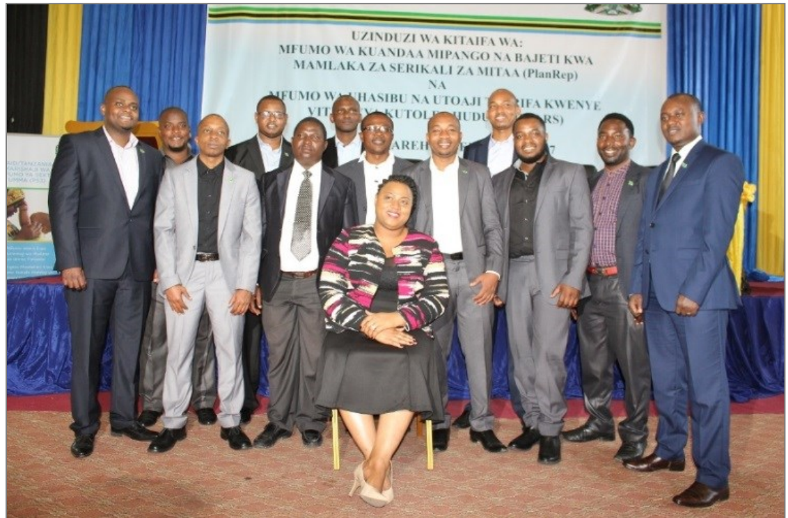
Baadhi ya wataalam wa Tanzania ambao walihusika katika uundaji wa PlanRep iliyooboreshwa, wakiwa katika picha ya pamoja wakati wa uzinduzi wa mfumo huo mjini Dodoma.